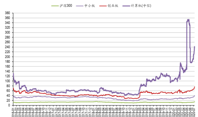
图 6：计算机板块历史市盈率