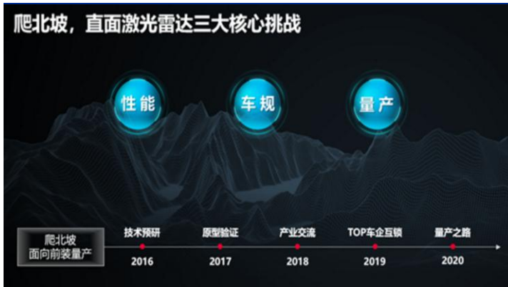
图 1：华为 16 年开始启动车规级激光雷达研发

12月21日，中国汽车工业协会主办的T10 ICV CTO峰会在上海召开，华为首次面向行业正式发布车规级高性能激光雷达产品和解决方案。华为此次发布车规级高性能激光雷达产品从一开始就选择了难度极高的面向乘用车的前装量产的产品化开发，而没有选择从传统旋转机械式激光雷达切入。其基于场景分析，华为设计、开发了这款96线中长距激光雷达产品，可以实现城区行人车辆检测覆盖，并兼具高速车辆检测能力，更符合中国复杂路况下的场景。