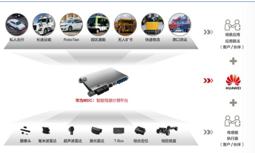
图 3：华为 MDC 智能驾驶计算平台的布局

华为车规级高性能激光雷达发布有望打破高级别自动驾驶量产成本瓶颈。华为智能汽车解决方案 BU 总裁王军公开表示未来计划将激光雷达的成本降低至 200 美元，这将打破高级别自动驾驶量产成本瓶颈。此前在广州车展上，小鹏汽车公布将在 2021 年率先在全球推出首款搭载激光雷达的量产智能电动汽车，长安汽车董事长朱华荣也公开宣布将携手华为、宁德时代，一起打造高端智能汽车品牌。在其公布的长安方舟架构中，将预留 36 个传感器，其中包含 5 个激光雷达。