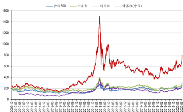
图 5：计算机历史走势